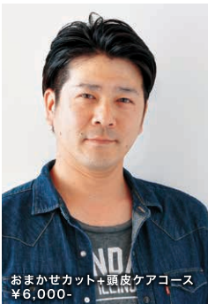
おまかせカット+頭皮ケアコース ¥6,000-