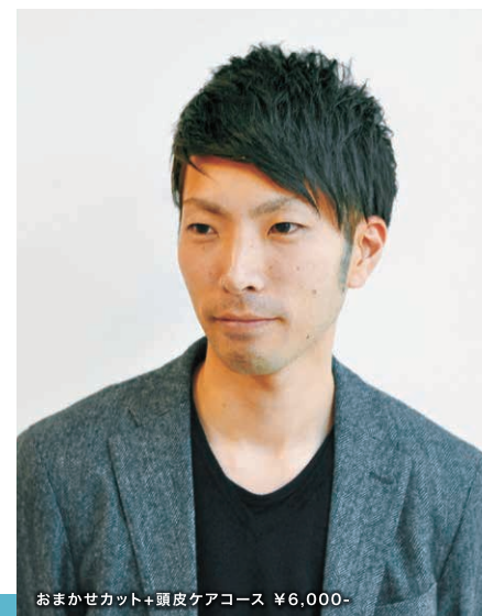
おまかせカット+頭皮ケアコース ¥6,000-