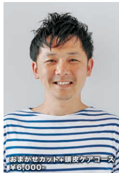
おまかせカット+頭皮ケアコース ¥6,000-