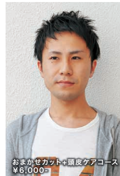
おまかせカット+頭皮ケアコース ¥6,000-