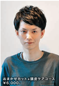
おまかせカット+頭皮ケアコース ¥6,000-