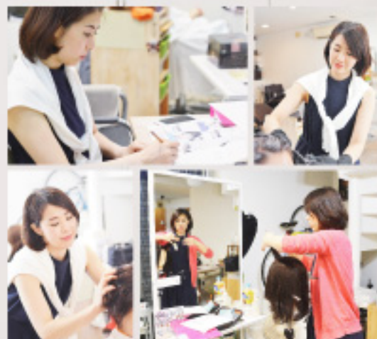
日々練習と勉強です