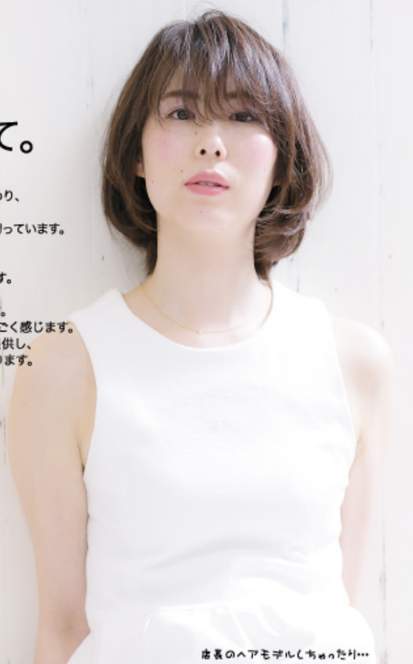
店長のヘアモデルしちゃったり...

昨年の6月からカットレッスンが始まりました。初めはハサミの持ち方、切り方、姿勢などから教わり、カットの基礎を学び、今はヘアスタイルを見てどのようにしているのか構成を考え、ウィッグを切っています。もう少しでモアルカットのレッスンになります。今まではウィッグだけを切っていたので、人をカットするのは楽しみと緊張が入り交じります。最近、ヘアセットに入る機会も多くなり、お客様に喜んでいただいた時は本当に嬉しいです。仕事のやりがいや楽しさが倍増する分、責任もすごく感じます。お客様一人ひとりのお悩みに合わせたキレイを提供し、喜んでもらえる美容師を目指し、日々精進して参ります。これからもよろしくお願いたします。スバも得意なので、是非♥お待ちしております。