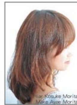
Hair Kosuke Morita Make Ayae Morita