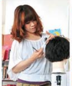
開店前、カットの練習します。