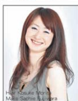
Hair Kosuke Morita Make Sachie Fujiwara