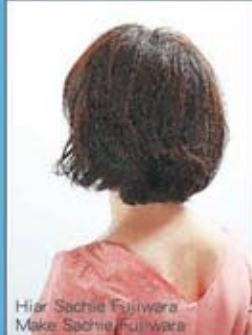
Hair Sachie Fujiwara Make Sachie Fujiwara

人気のボブスタイルにパーマで毛先の動きをだして、無造作感を演出。ワックスをもみ込んで、簡単にスタイリングを決められます。重ねボブからの手軽なスタイルチェンジとしておすすめ。